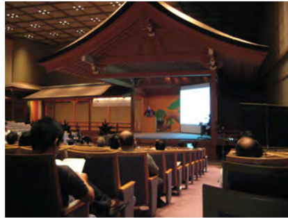
Plenary talk at noh theater.

口頭発表のセッションは2会場(最終日のみ3会場)で行われた。中でもPlenary talk等のある会場は能舞台として作られており、発表者は舞台上に登壇して講演を行った。木村准教授はスピン分解光電子分光のセッションで招待講演を行った。光電子分光、内殻吸収分光をはじめと